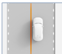
Permanencia en el carril